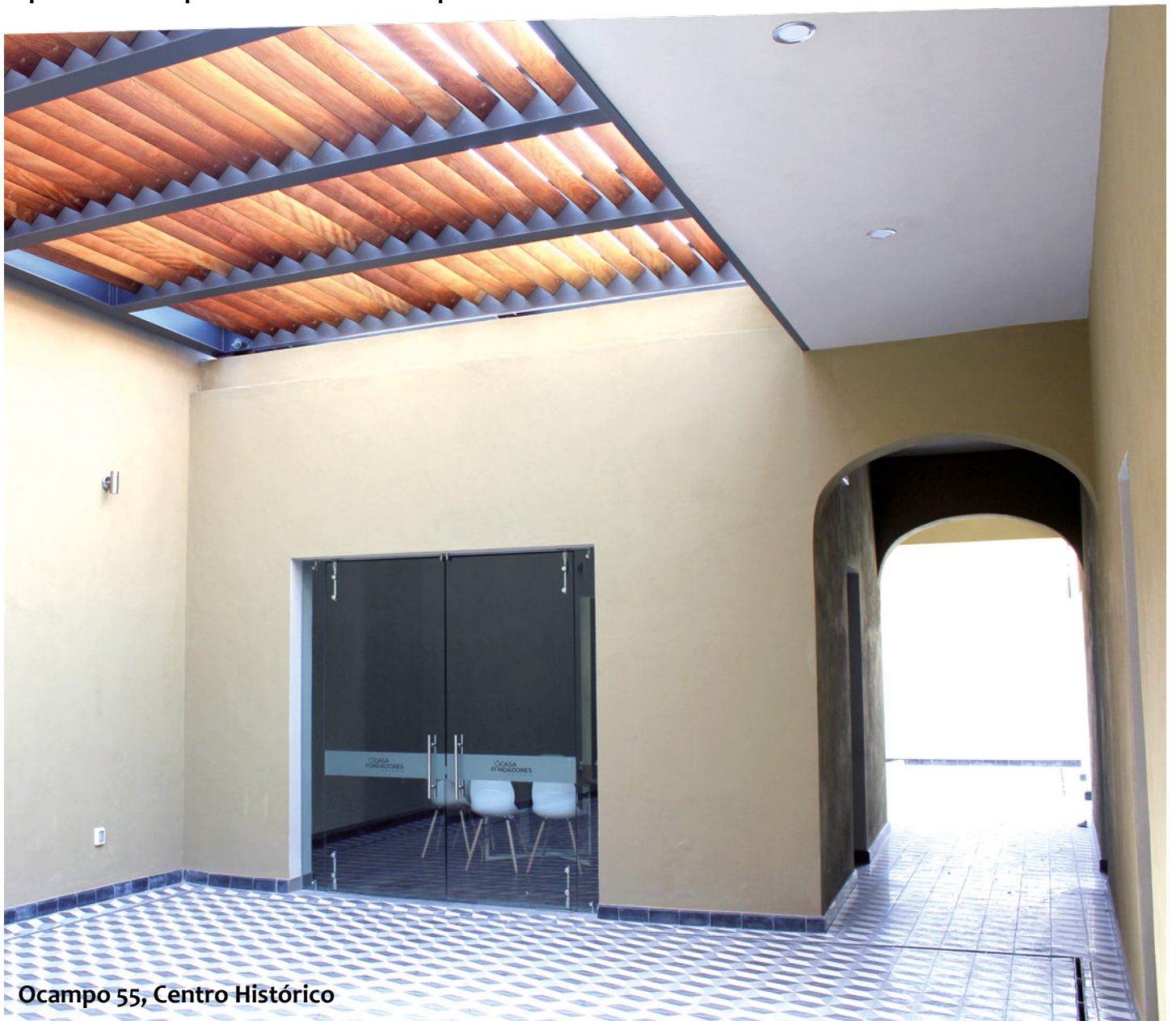
Ocampo 55, Centro Histórico

Hoy, este espacio fue rescatado y remodelado por el Comité Estatal para dar lugar a Casa Fundadores, un espacio cultural para el disfrute de los queretanos.